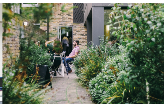
Zvonek na zahradu