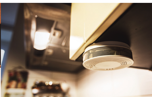
Požár v kuchyni